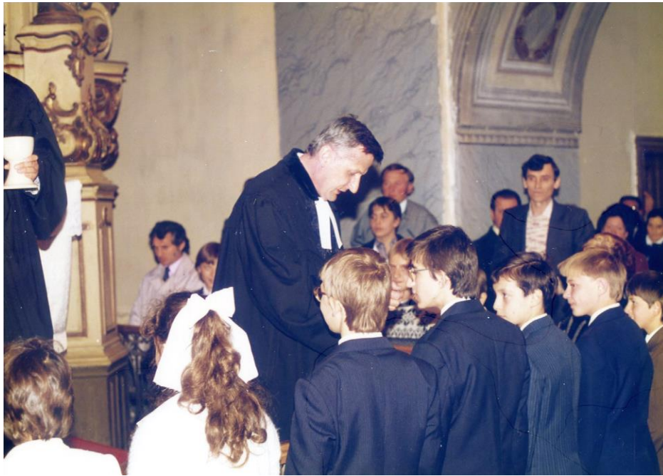
A nyíregyházi szolgálat jeles napjainak egyike. Konfirmáció a Nagytemplomban.